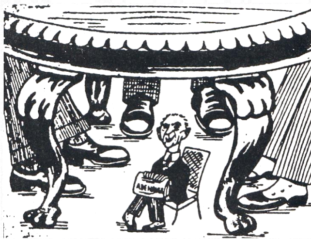
„Bundeskanzler Adenauer im Amt“ (Nationalzeitung Berlin (Ost), 01.10.1949) Karikatur zur Gründung der BRD aus der Sicht der SBZ