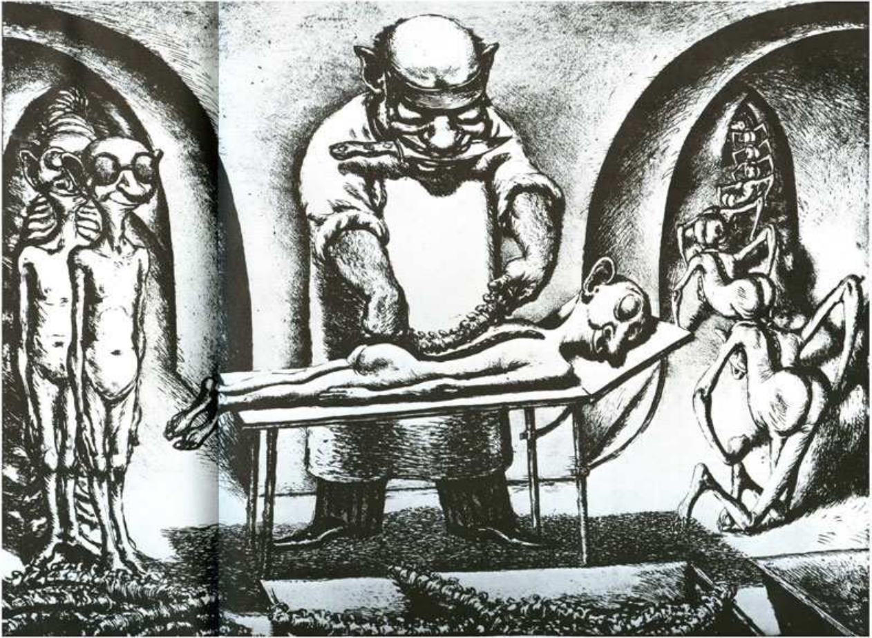
In: Dokumentation Das III. Reich, Bd. 1, M. Pawlak Verlag, Hamburg 1989, S. 101