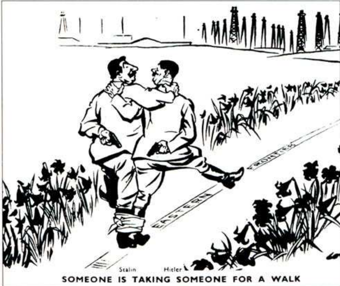
David Low, 1939